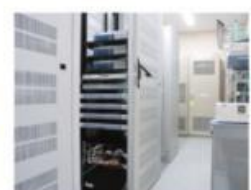
▲システムの制御装置は冗長化、及び二重化