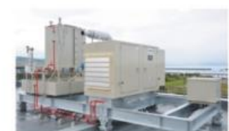
▲津波を想定し本部屋上に設置された非常用発電機