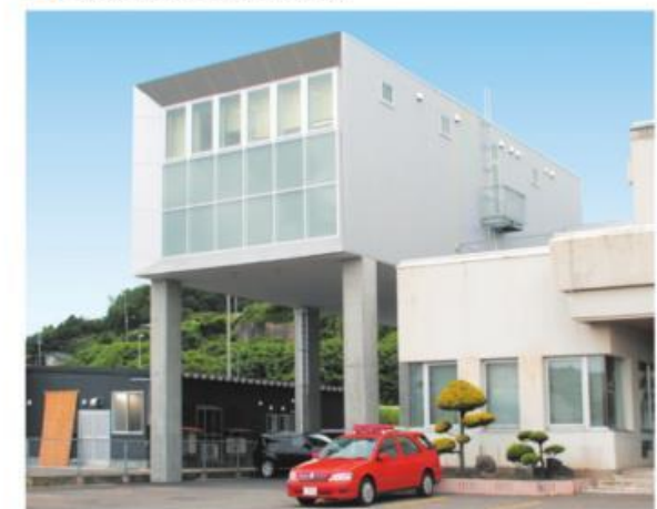
▲床面の高さが9.5mの新通信指令室