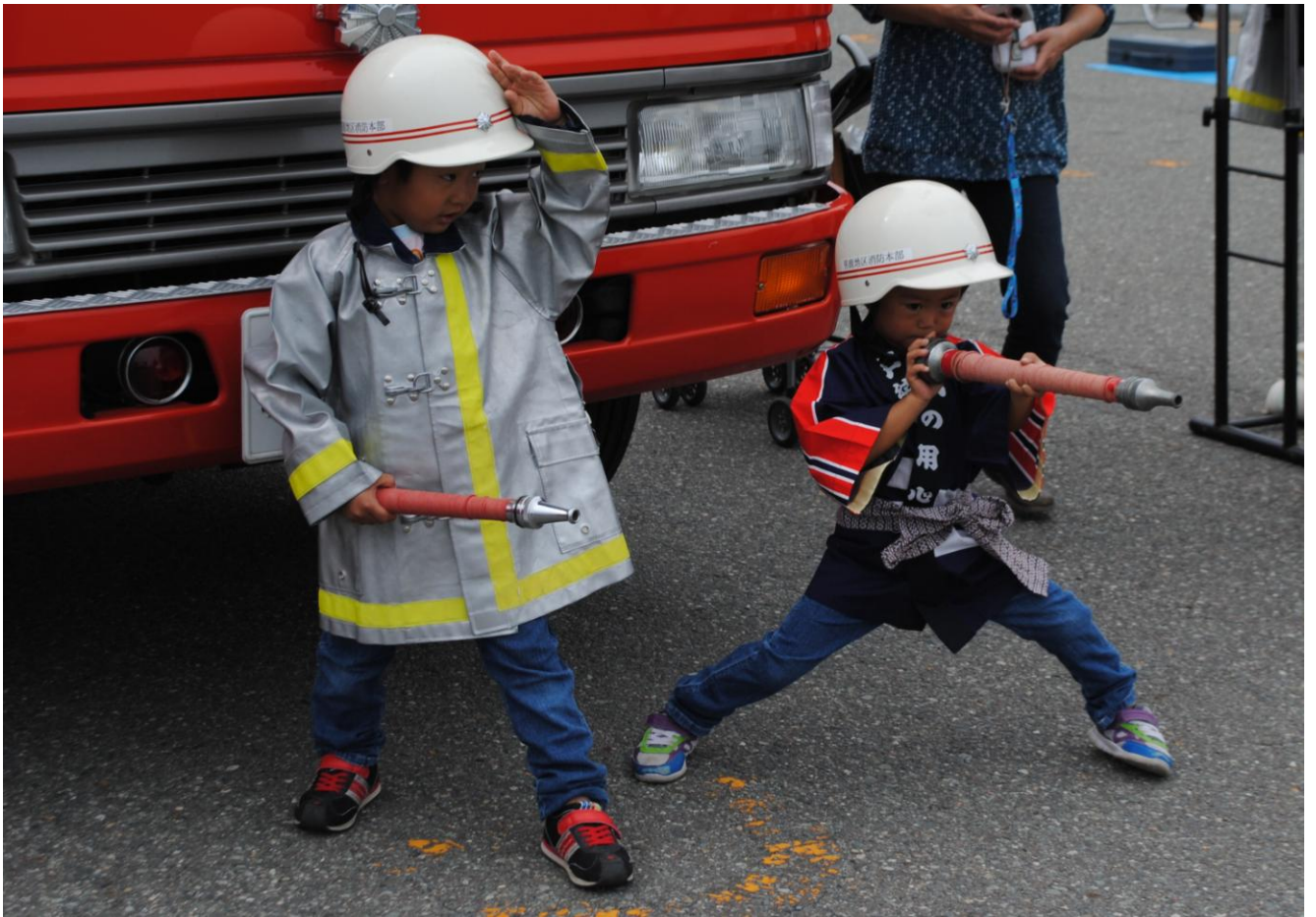
消防ふれあい広場