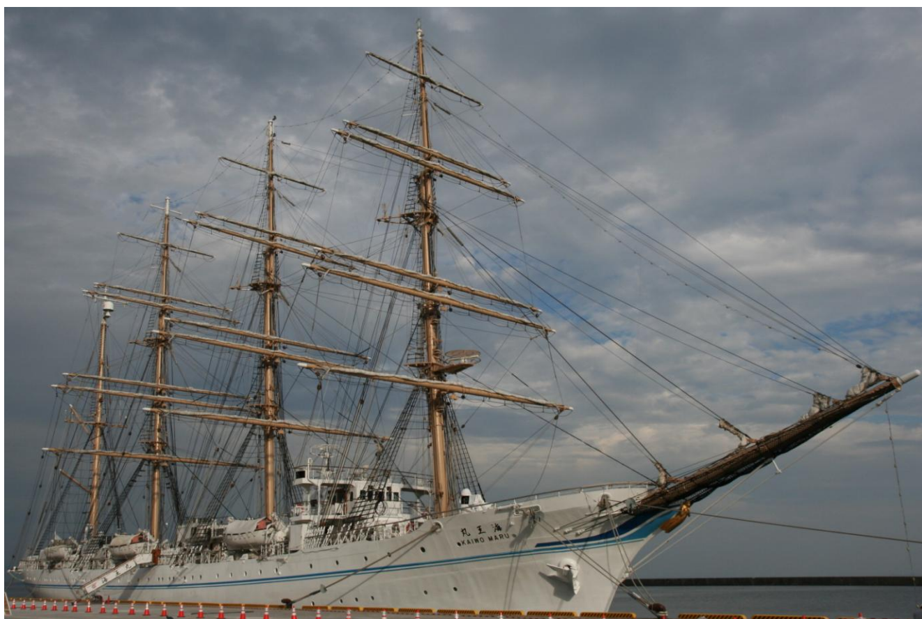
海王丸ー船川港に寄港（海フェスタ）