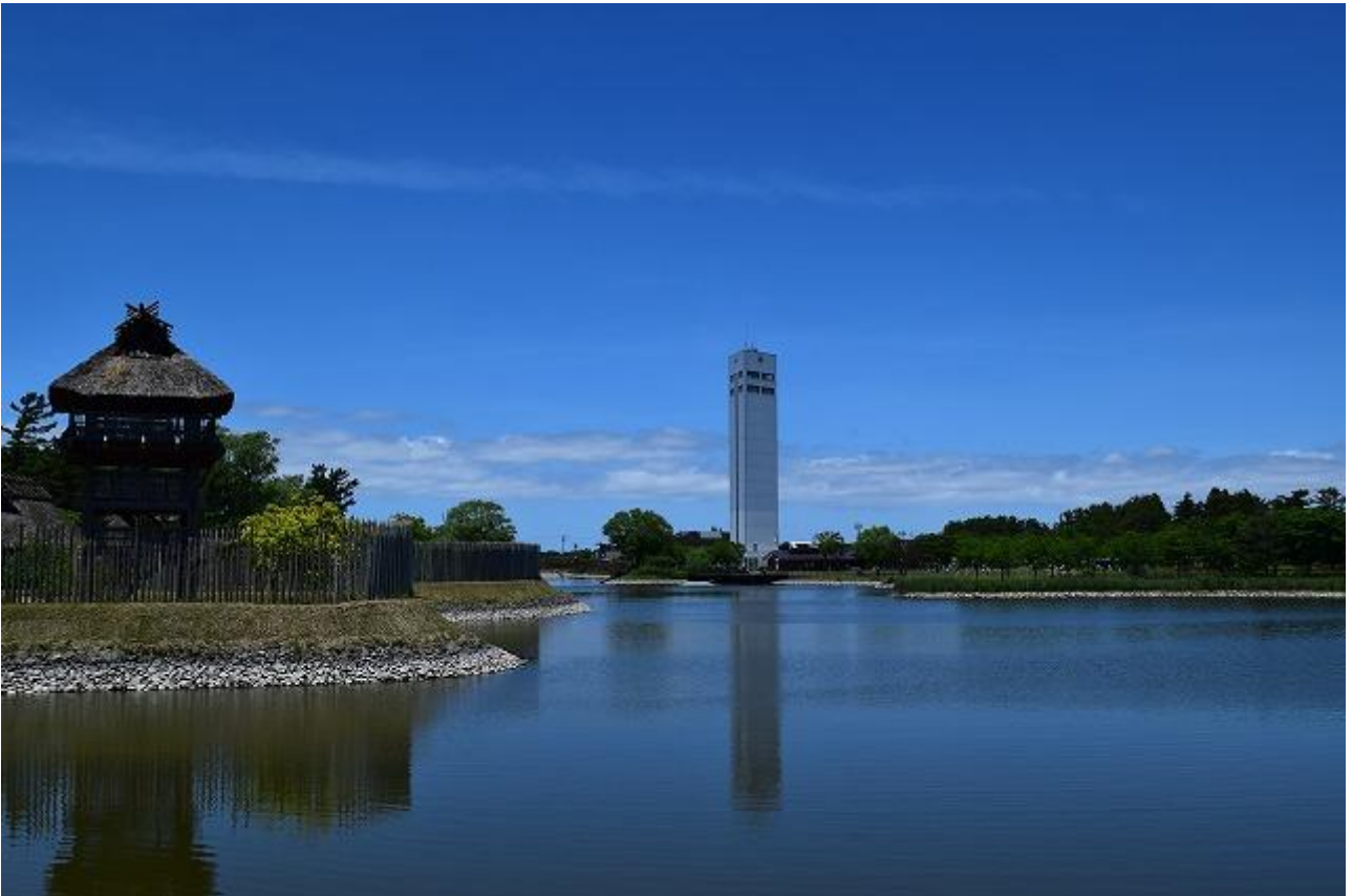
天王スカイタワー（潟上市）