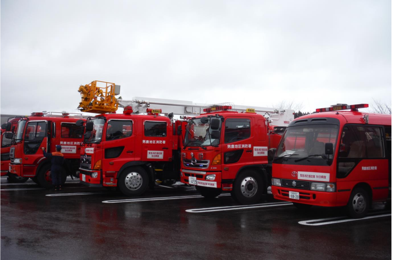
第5回全国緊急消防援助隊合同訓練参加