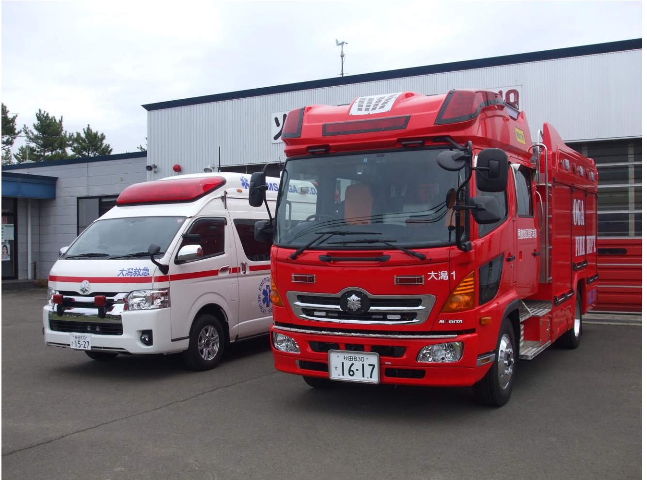
新大潟1号車・新大潟救急車