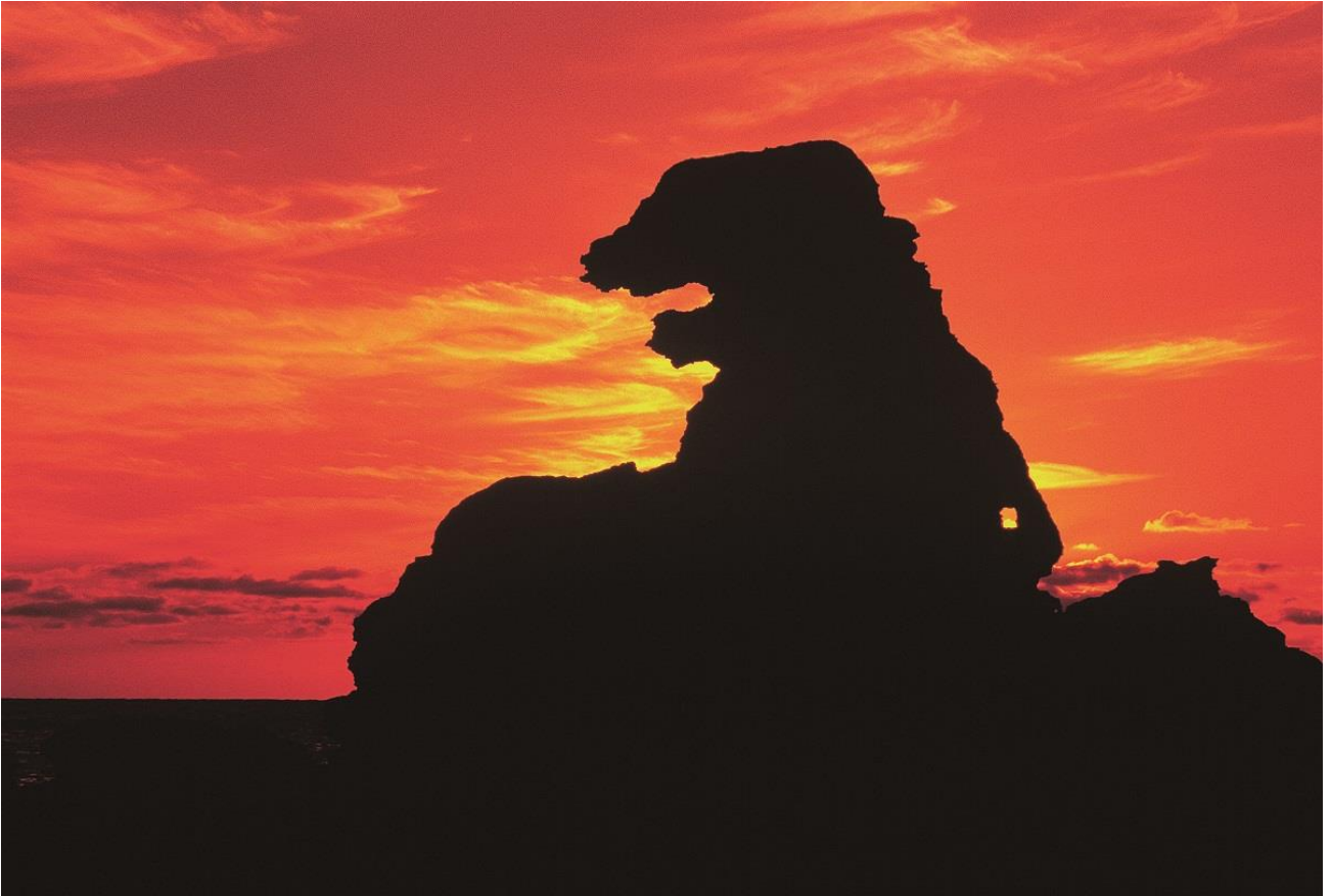
夕陽のゴジラ岩（潮瀬崎）