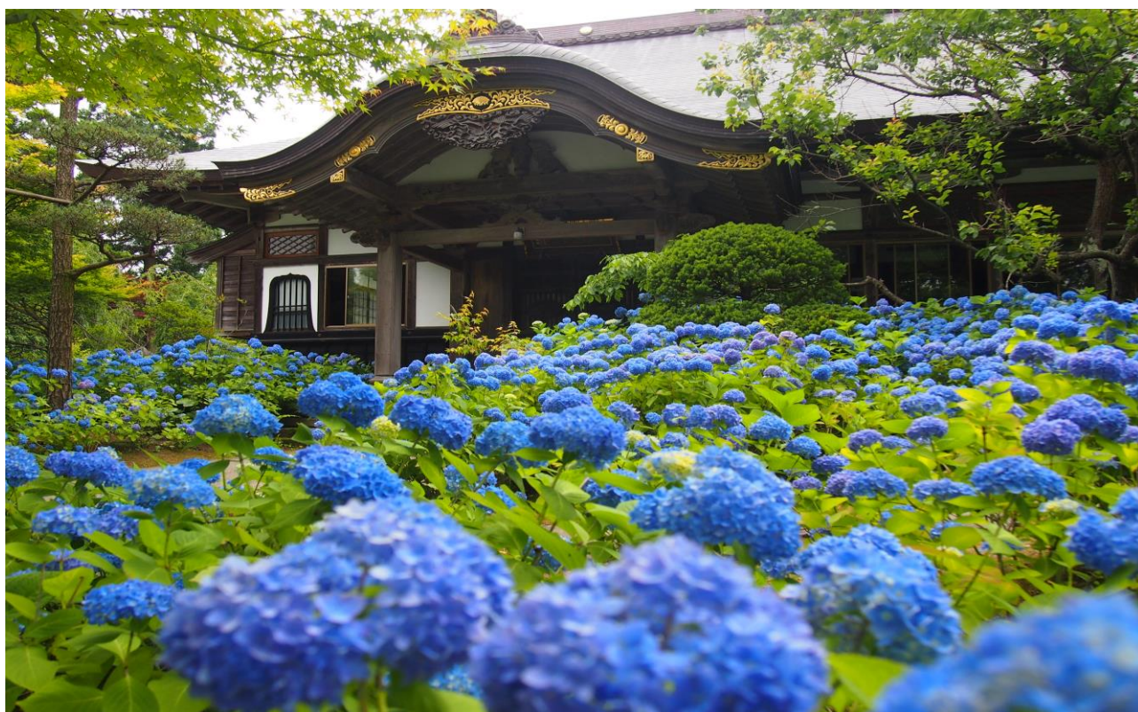
あじさい寺「雲昌寺」