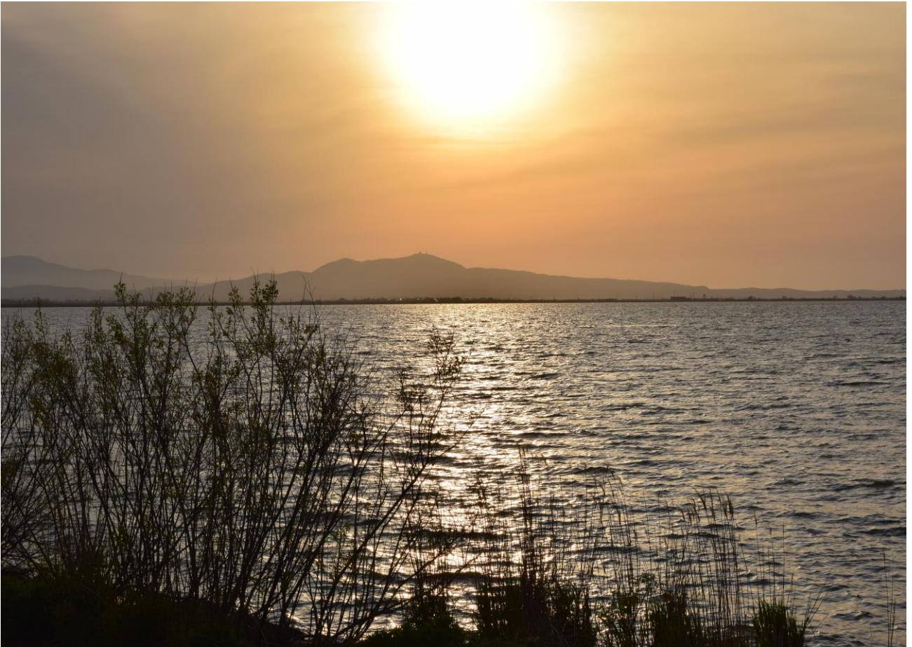
寒風山と八郎潟残存湖